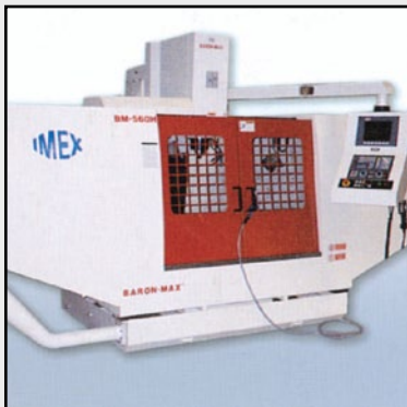
Centre d'usinage à commande numérique 1300 x 600 x 600 mm