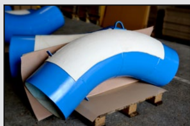
Colmatage de fuite