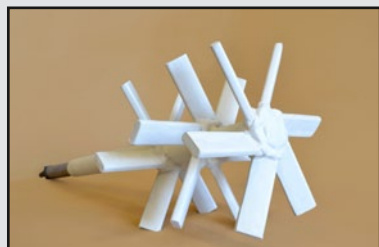
Protection contre agression chimique