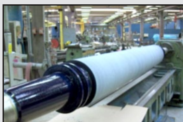
Solution « COMPORFLEX »