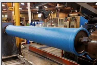
Garnissage CSM spécifique