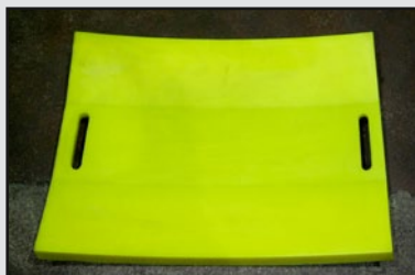
Cale de coil