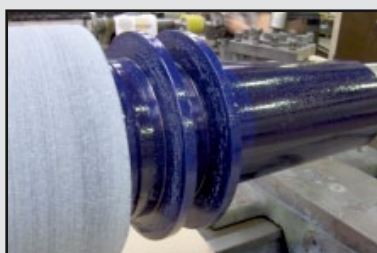
Solution « COMPORFLEX »